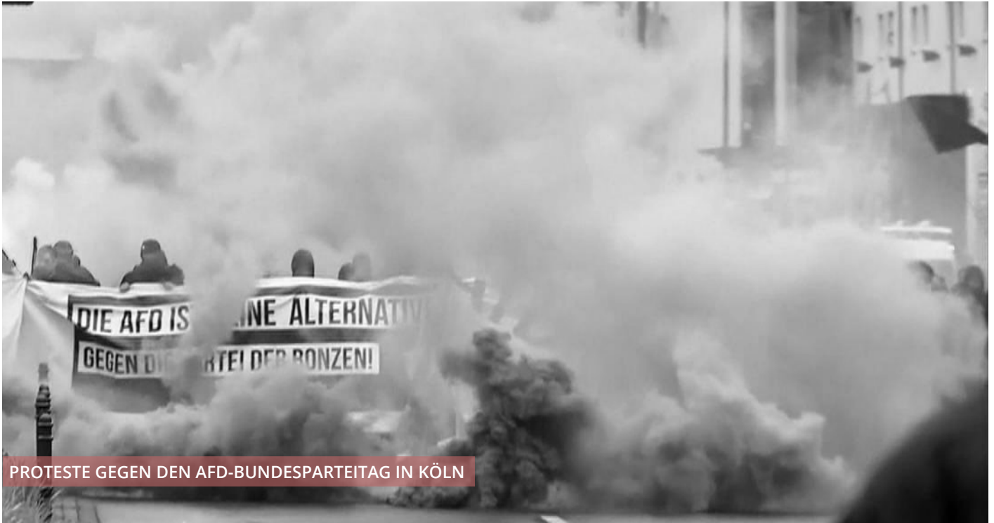
PROTESTE GEGEN DEN AFD-BUNDESPARTEITAG IN KÖLN

Wir wollen hiermit unsere Standpunkt zum Thema Antifaschismus beginnen. Was? Schon wieder Antifaschismus? Schon wieder „In Zeiten des Rechtsrucks helfen Sitzblockaden alleine nicht weiter“? Ja schon wieder. Trotz jahrelanger „Krise der Antifa“ und „Antifa-Debatte“ in allen möglichen Diskussionsrunden, in der Analyse & Kritik, der Jungen Welt und dem Neuen Deutschland ist unser Problem noch nicht gelöst. Das hat viele Gründe. Meistens liegt es daran, dass immer nur der naheliegendste Feind analysiert wird, nach dem Motto „Was tun gegen die AFD“. Die AFD ist zwar einer der dankbarsten Gegner für uns, wenn wir aber bei ihr stehenbleiben, unterscheiden wir uns kaum von x-beliebigen bürgerlichen Bündnissen. Manchmal liegt es daran, dass kein gründlicher Bezug zum kapitalistischen System hergestellt wird. Dann wird Antifa zur Feuerwehrpolitik gegen einzelne Nazis. Manchmal wird alles neben der sozialen Frage vergessen und schon ist Anti-Gentrifizierung eigentlich genug Antifa.